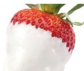
CHOCOFONT BLACO/WHITE CHOCOFONT