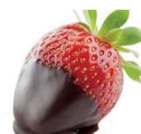
CHOCOFONT NEGRO/BLACK CHOCOFONT